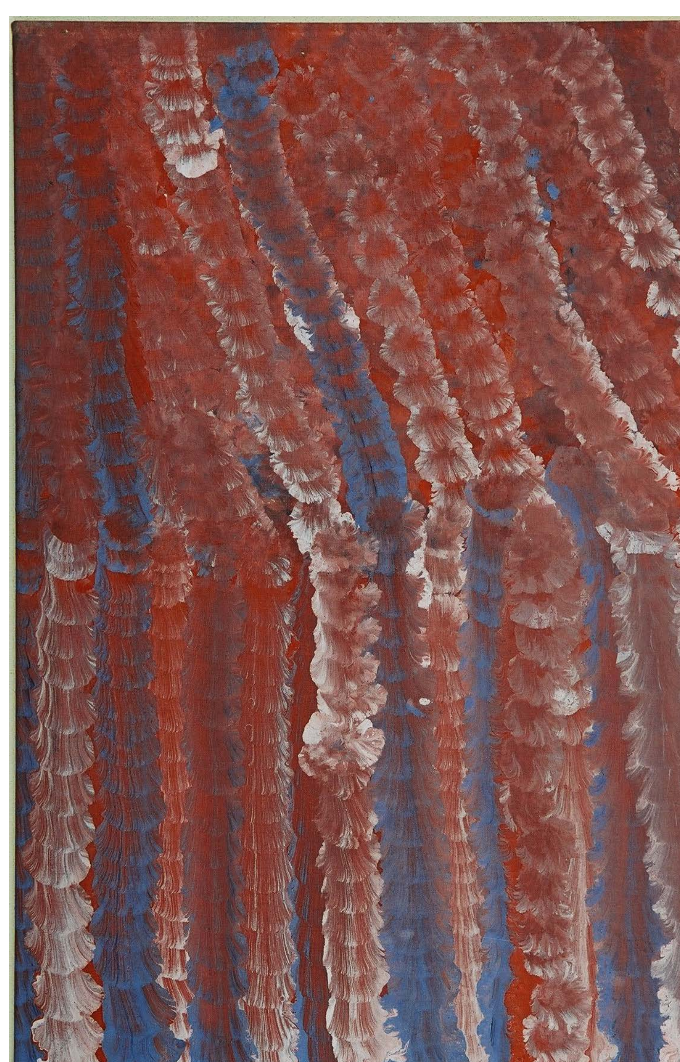
Emily Kame Kngwarreye,